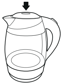
Рисунок – 1