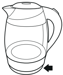
Рисунок – 3

— Наполните чайник холодной водой, следите за метками.