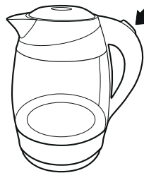
Рисунок – 5

— Перед снятием с базы убедитесь в том, что чайник выключен (переключатель в положении 0).