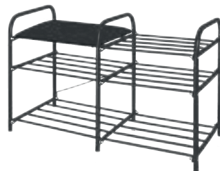
арт. ЭТЛ3, ЭТЛ3-1