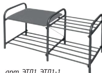
арт. ЭТЛ1, ЭТЛ1-1

Этажерка для обуви "Люкс" арт. ЭТЛ1, ЭТЛ1-1, ЭТЛ2, ЭТЛ3, ЭТЛ3-1, ЭТЛ4