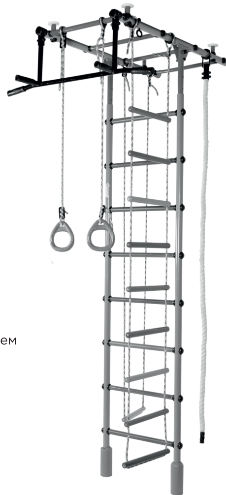
Схема регулировки высоты комплекса:

До установки в рабочее положение хранить комплекс в упаковке производителя в сухих закрытых помещениях.