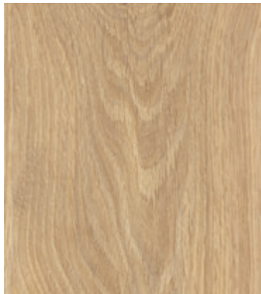
Дуб Алжирский Кремовый