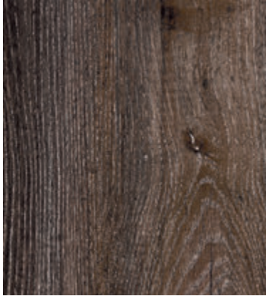
Дуб Каньон Чёрный