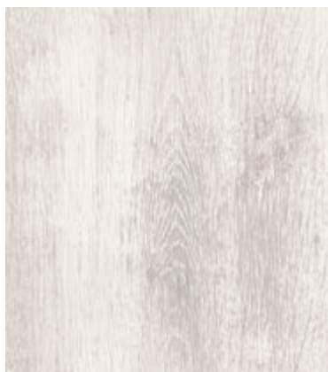
Дуб Эверест Светлый