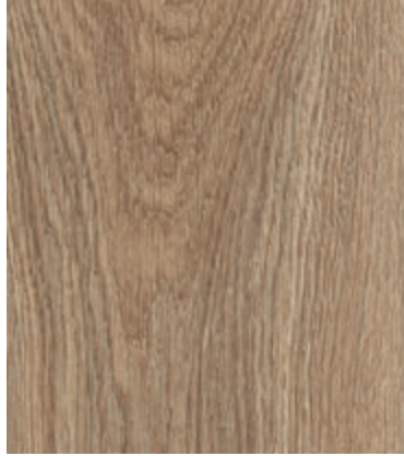
Дуб Палермо Классический