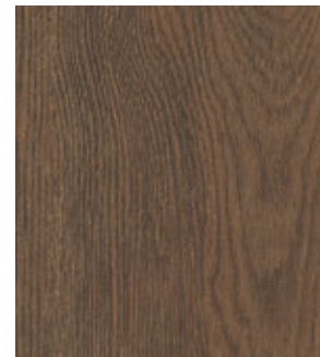
Орех Скандинавский Тёмный FP21