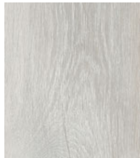
Дуб Пепельный FP11