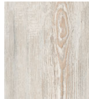
Сосна Лагерта светлая FP200