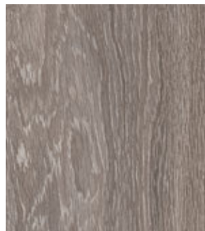
Дуб Каньон Серый FP19