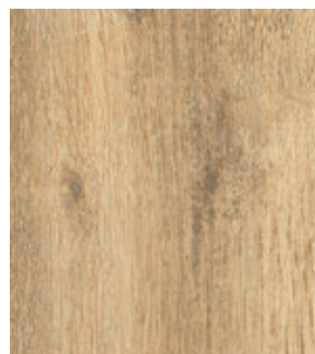
Дуб Даман FP15