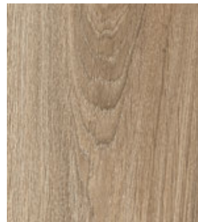
Дуб Вивьен FP18