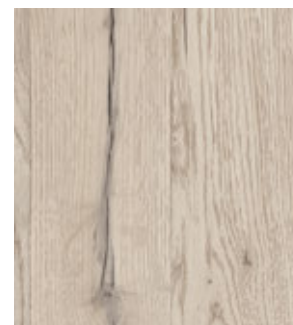
Дуб Тор FP202