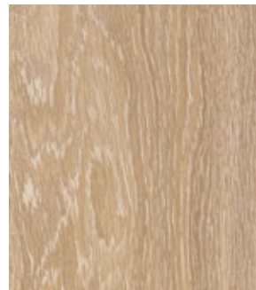
Дуб Каньон Кремовый FP16