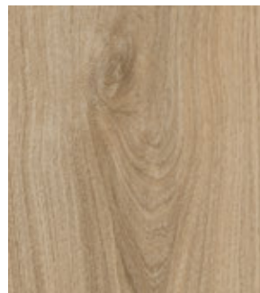
Дуб Каньон Натуральный FP13