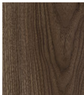
Дуб Бразильский FP20