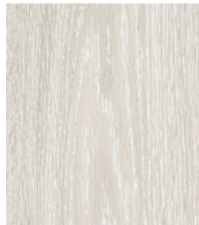
Дуб Онтарио FP09