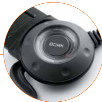
Датчик контроля температуры