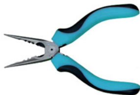
2. Плоскогубцы, для обжима троса