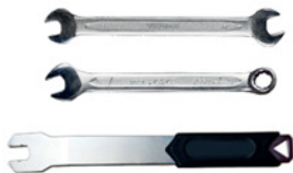
5. Ключ (8, 9, 10, 15)