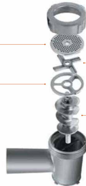
Фиксатор решетки для фарша