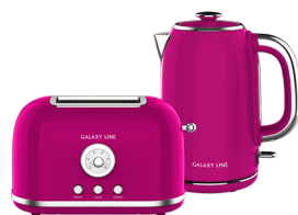
GL2916/ GL0346 МАЛИНОВЫЙ ДЖЕМ