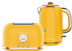
GL2915/ GL0345 БАНАНОВЫЙ ПУНШ