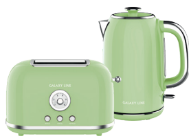
GL2911/ GL0344 РАЙСКАЯ ОЛИВА