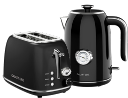
GL2920/ GL0350 МАГИЯ ЧЕРНОГО