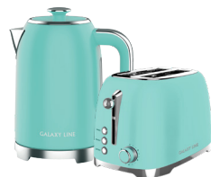
GL0347/ GL2917 ТИФФАНИ