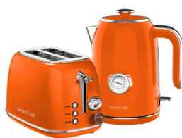
GL2921/ GL0351 АПЕЛЬСИНОВЫЙ ФРЕШ