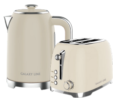
GL 0348/ GL2918 КРЕМ-БРЮЛЕ