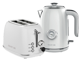
GL2922/ GL0352 СЛИВОЧНЫЙ ЗЕФИР