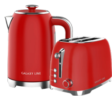
GL0349/ GL2919 ФЕРРАРИ