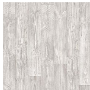
AUSTRALIAN PINE 1

Ширина: 2,5/3/3,15/3,5/4 М Размерность дизайна: 16,6 x 100 см