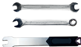
5. Ключ (8, 9, 10, 15)