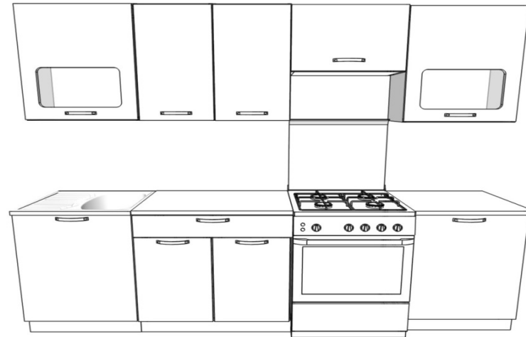
рисунок имеет общий характер (набор ящиков может различаться)