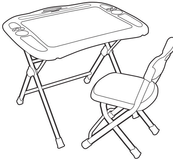
(рис. 1) Комплект (арт. NKP1)

Перед применением следует ознакомиться с паспортом и руководством по эксплуатации. Следуя инструкции, выполните установку стола и стула.