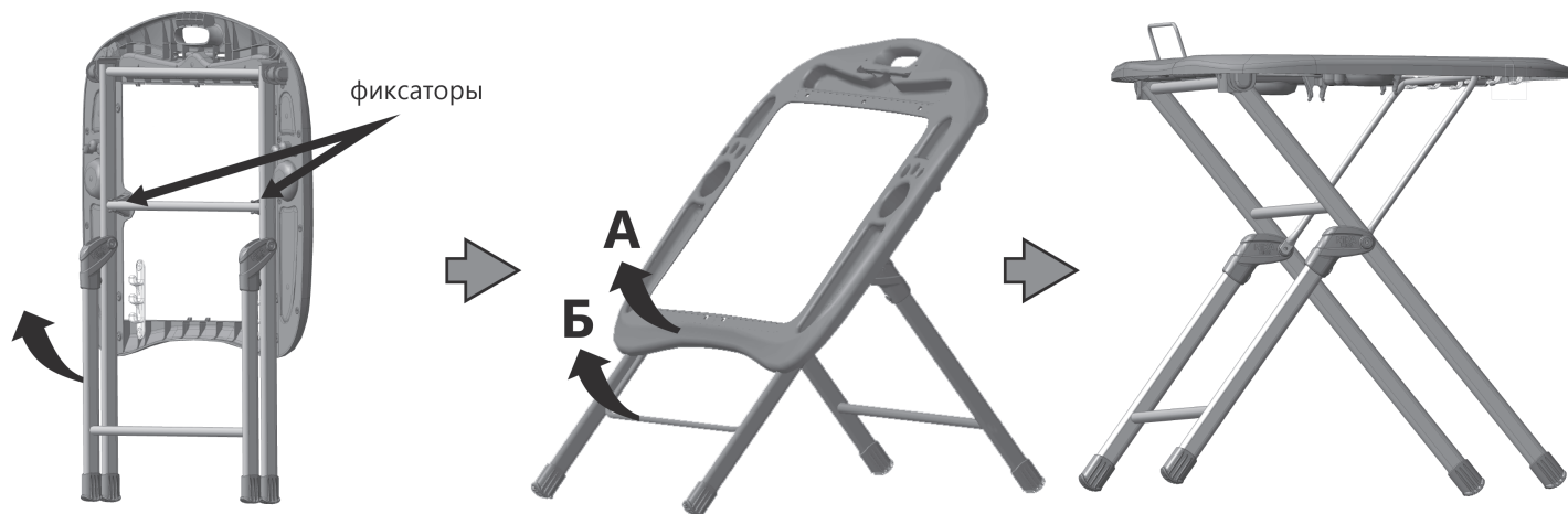
(рис. 2) Схема раскладывания стола