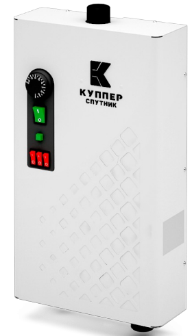
Куппер Спутник 2.0