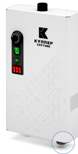
Куппер Спутник-6 2.0