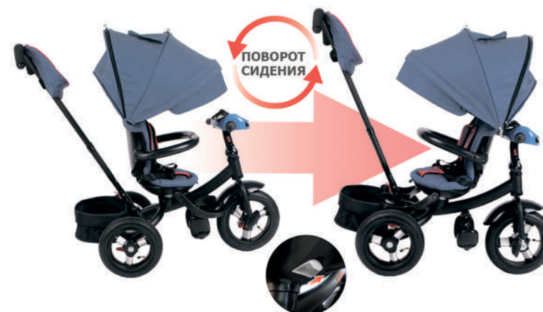
Отожмите (от центра) 2 кнопки под сидением и поверните сидение.