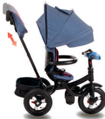
Регулировка ручки управления