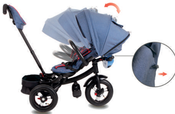
Наклон спинки. Отожмите вверх рычаг сзади спинки и наклоните спинку сидения до нужного положения.