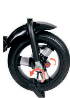
Функция свободного колеса