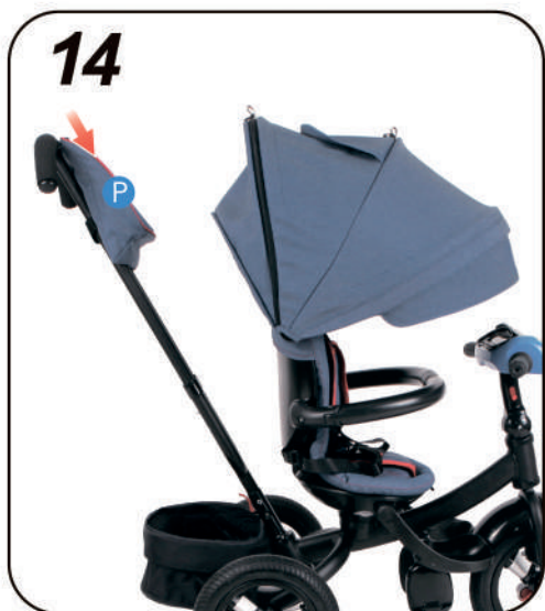
14. Зафиксируйте сумочку (P) на ручке управления (J)