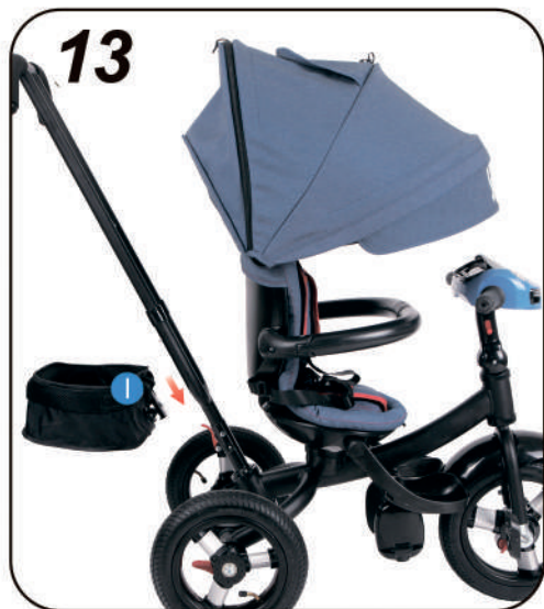
13. Установите заднюю багажную корзину (I)