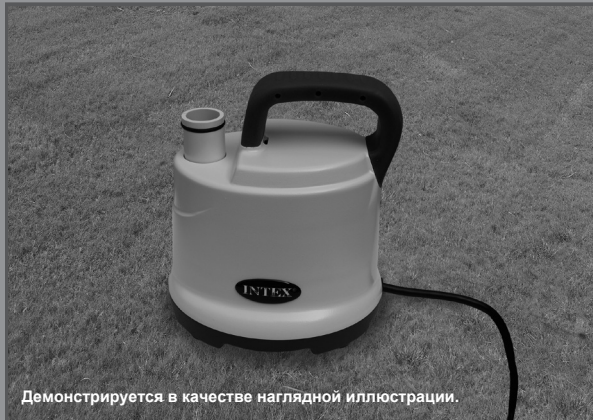
Демонстрируется в качестве наглядной иллюстрации.

Дренажный насос Модель DP30220 220 - 240 V~, 50 Hz, 99 W Hmax 2.5 m, Hmin 0.01 m, IPX8