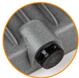
Клапан выравнивания давления и отвода конденсата