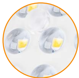
Линзы из поликарбоната

Для освещения зданий и архитектурных сооружений