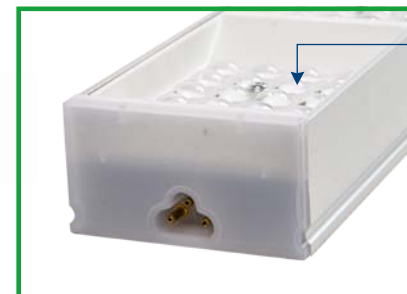
Блочная линза из поликарбоната!