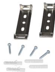
Монтажные клипсы в комплекте!