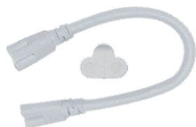
Гибкий переходник для последовательного соединения и заглушка