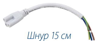
Шнур 15 см