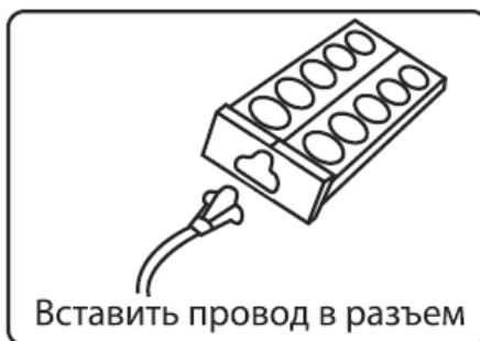
Вставить провод в разъем