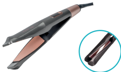
GL4521 ЩИПЦЫ ДЛЯ ВОЛОС