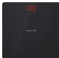
GL4826 ВЕСЫ БЫТОВЫЕ ЭЛЕКТРОННЫЕ