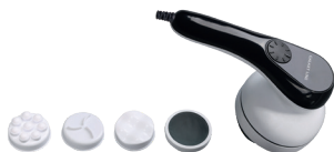
GL4943 МАССАЖЕР ДЛЯ ТЕЛА ЭЛЕКТРИЧЕСКИЙ

ИЗГНУТЫЕ ПЛАСТИНЫ ДЛЯ ВЫПРЯМЛЕНИЯ И ЗАВИВКИ ВОЛОС