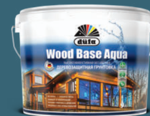
WOOD BASE AQUA грунтовка для древесины

Для достижения идеального результата в комплексе с WOOD COLOR мы рекомендуем использовать специальную блокирующую грунтовку на водной основе düfa WOOD BASE AQUA .