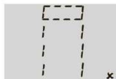
Требуется карта Собственности

Если вы видите эти изображения и слышите повторяющийся гудок, нужно приложить соответствующую карту, чтобы завершить операцию. Если не сделать этого прямо сейчас, терминал вернётся к основному экрану.