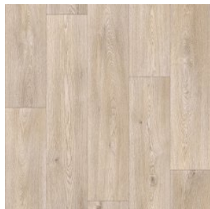
COLUMBIAN OAK 5

Ширина: 2,5/3/3,5/4 М Размерность дизайна: 20 x 150 см