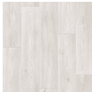
COLUMBIAN OAK 11

Ширина: 2,5/3/3,5/4 М Размерность дизайна: 20 x 150 см