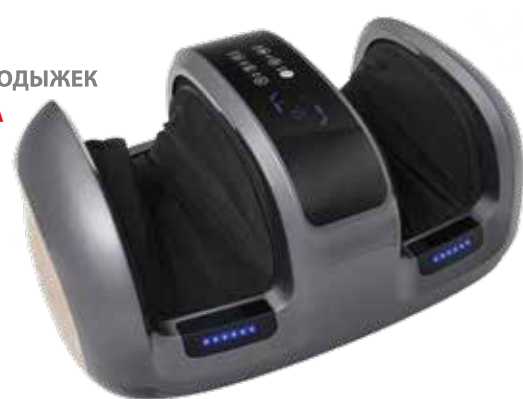
KZ 1180 МАССАЖЕР ДЛЯ НОГ СО СЪЕМНЫМИ ЛИМФОДРЕНАЖНЫМИ МАНЖЕТАМИ ВИВО