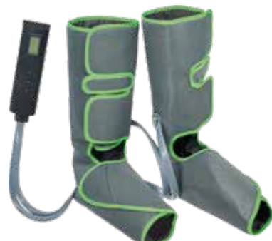
KZ 1166 КОМПРЕССИОННЫЙ ЛИМФОДРЕНАЖНЫЙ МАССАЖЕР ДЛЯ НОГ