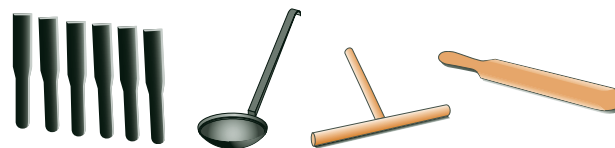
Мини-лопаточки (1) Половник (2) Распределитель (3) Лопатка (4)