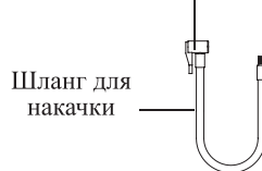
Шланг для накачки