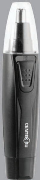
ПРОДАВЕЦ / ФИРМА-САТУШЫ