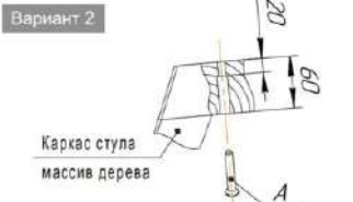
Общий вид сидения