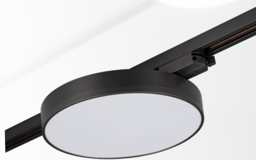
PTR 1835-T540 32w BL