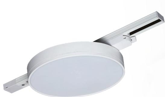
PTR 1835-T540 32w WH