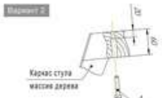
Общий вид сидения