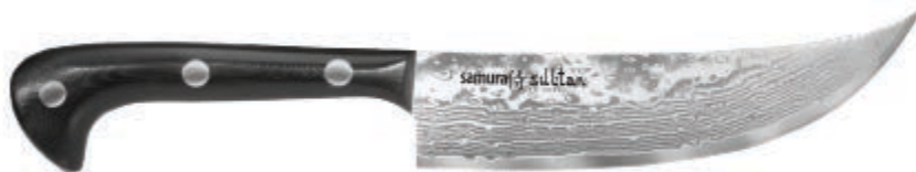
SU-0086D НОЖ ШЕФ 159 MM / 6.5"