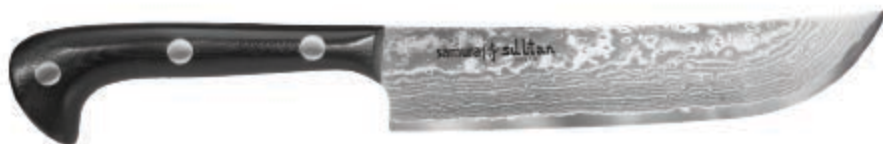
SU-0085D НОЖ ШЕФ 164 MM / 7"