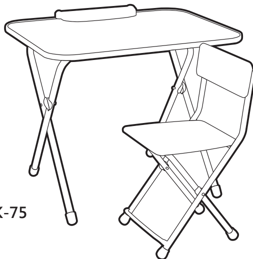
(рис. 1) Комплект мебели, арт. NK-75

Перед эксплуатацией следует ознакомиться с паспортом и руководством по эксплуатации. Следуя инструкции, выполните установку стола и стула.