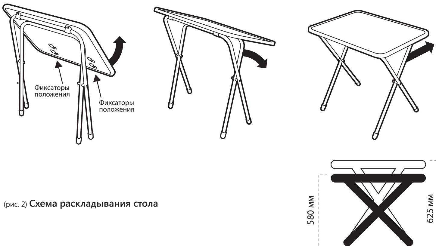
(рис. 2) Схема раскладывания стола

Соответствует требованиям ТР ТС 025/2012 «О безопасности мебельной продукции» ТУ 561812-001-84597115-2014. Модели: СВ, СВМ. Сведения о документах, подтверждающих соответствие, указаны на сайте изготовителя. Сделано в России.