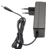
Зарядное устройство для аккумулятора