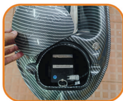
1. Поднимите крышку аккумулятора отсека