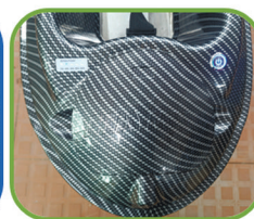
4. Плотно закройте аккумуляторный отсек