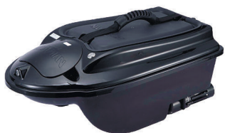
Прикормочный кораблик Boatman Actor Plus