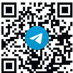
Чат для подписчиков