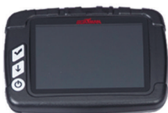
Дисплей эхолота (для Actor Sonar/Pro)