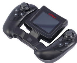
Пульт управления Actor Plus GPS/Pro