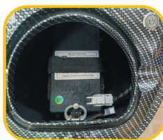
2. Подключите кабель к разъему аккумулятора