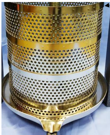
Рис. 2 Установка корпуса

7.2. Установить корпус в тарелку как показано на рис. 2 ободом вверх.