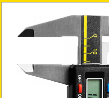
Закаленные губки для измерения внутреннего и наружного размера

0.01 разрешение, мм DIGITAL 00.00 INOX STEEL Нержавеющая сталь 3 FUNCTION 3 функции измерения ZERO FUNCTION Функция обнуления ON/OFF FUNCTION Клавиши выключения