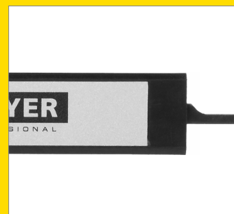
Прочная направляющая из композитных материалов

0.10 разрешение, мм DIGITAL 00.00 2 in 1 мм и дюймы ZERO FUNCTION Функция обнуления ON/OFF FUNCTION Клавиши выключения ABS PLASTIC Пластиковый корпус