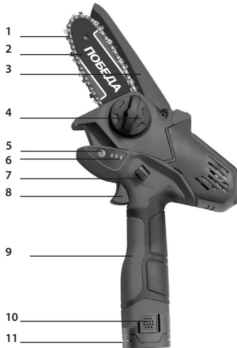
УСТРОЙСТВО ЦЕПНЫХ АККУМУЛЯТОРНЫХ ПИЛ (Рис. 1)