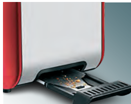
Съемный поддон для крошек