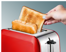
Высокий безопасный подъем тостов