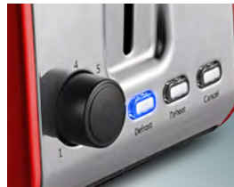
Светодиодная подсветка кнопок