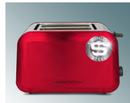
Материал корпуса: сталь