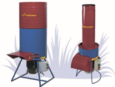
Кормоизмельчитель Для травы, сена и соломы