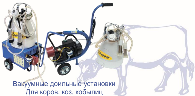
Вакуумные доильные установки Для коров, коз, кобылиц