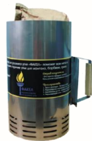
Кружка-стартер для розжига