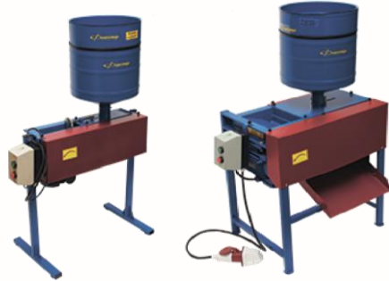
Агрегаты вальцовые для плющения