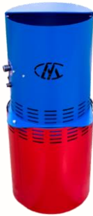
Домашний кормоцех универсальный