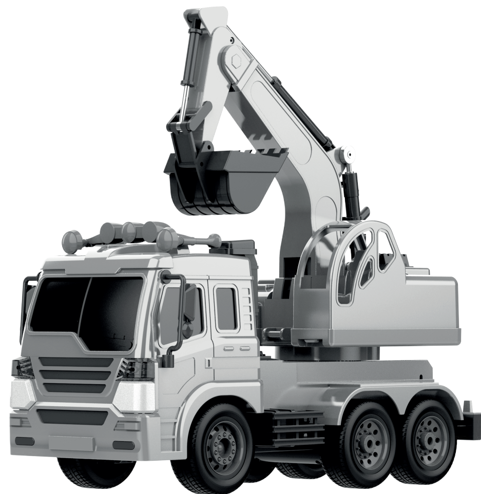
Игрушка для детей старше 6 лет