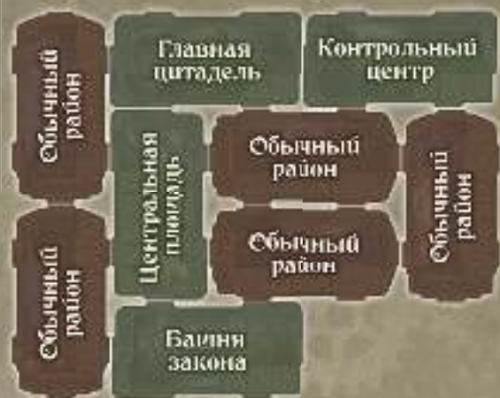
Стандартный вариант № 4