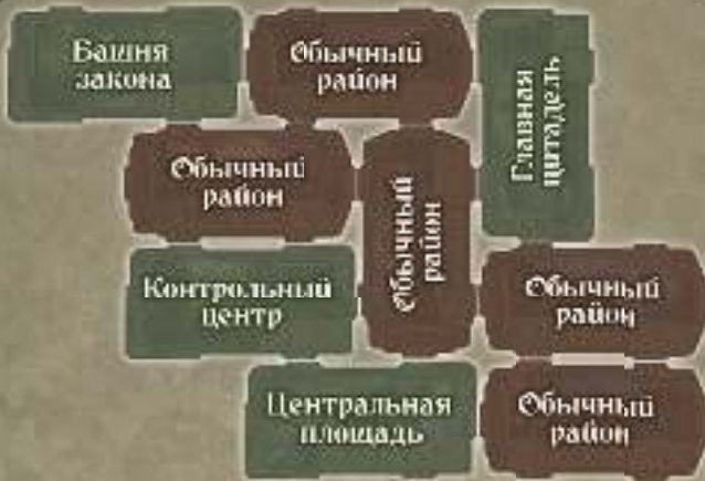
Стандартный вариант № 3