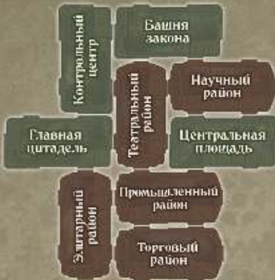
Стандартный вариант № 1