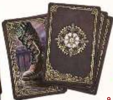
13 карт движения слуг