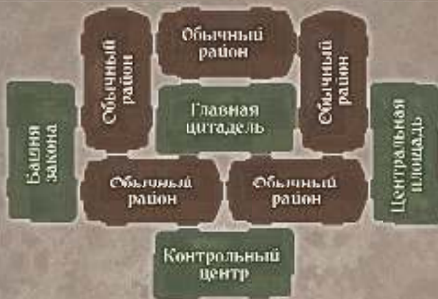
Оригинальный вариант № 5