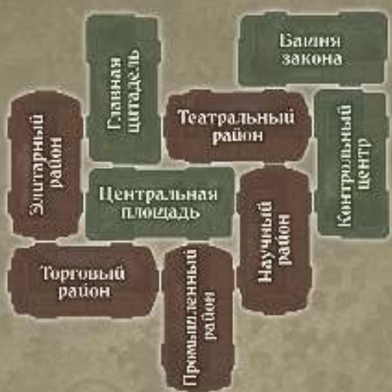
Стандартный вариант № 2