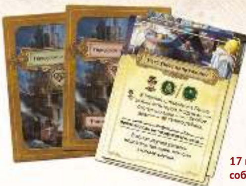
17 карт городских событий