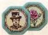
3 жетона героев

⚡ В режиме Автомы вам также понадобятся все игровые компоненты , перечисленные в правилах игры на с. 4–5 , за исключением 21 карты городских событий и 9 карт директив (в режиме Автомы они другие), а также 2 памяток Великой машины. Жетоны слуг используются только в одной из миссий.