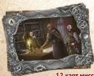
12 карт миссий

* Вооружение используется в дополнении «Конфронтация».