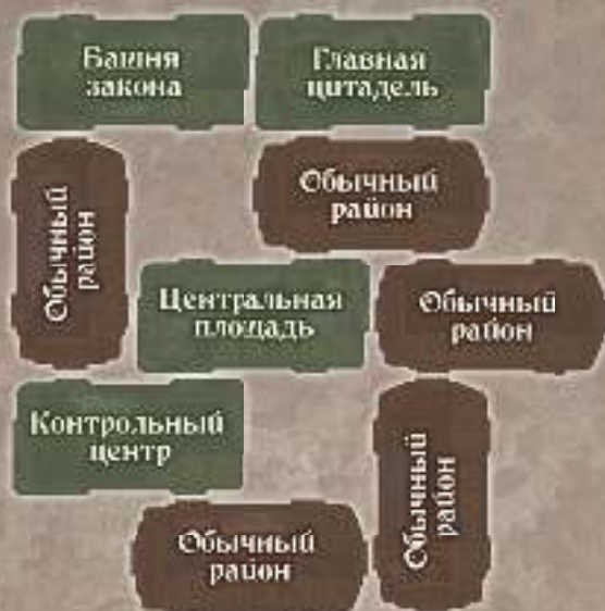
Оригинальный вариант № 6