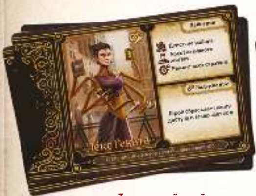
3 карты действий слуг