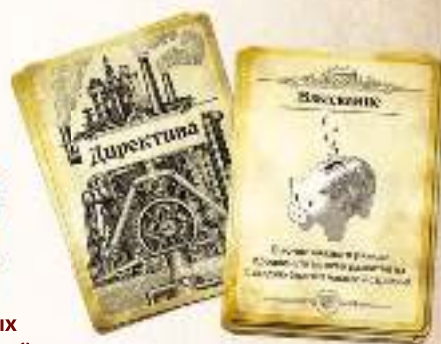
9 карт директив