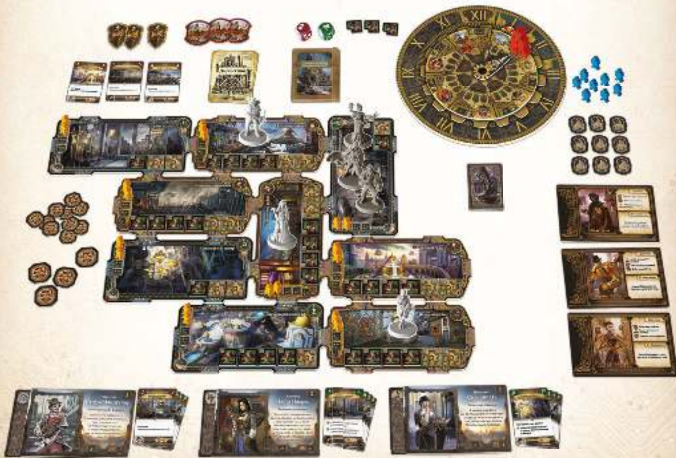
Пример подготовки к игре в режиме Автомы (карты миссий не показаны)