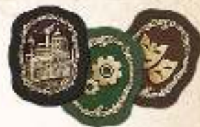
9 жетонов районов