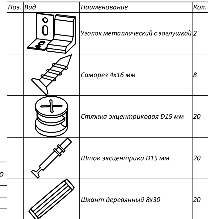
Спецификация на панели

Уголки крепёжные необходимы для фиксации стеллажа к стене для предотвращения шатания, качения и сдвига в процессе использования. Ввиду универсальности стеллажа его можно ставить не только на пол, друг на друга, но и подвешивать на стену. В этом случае необходимо самостоятельно приобретать дополнительную подвесную фурнитуру. Также можно приобрести декоративные опоры.