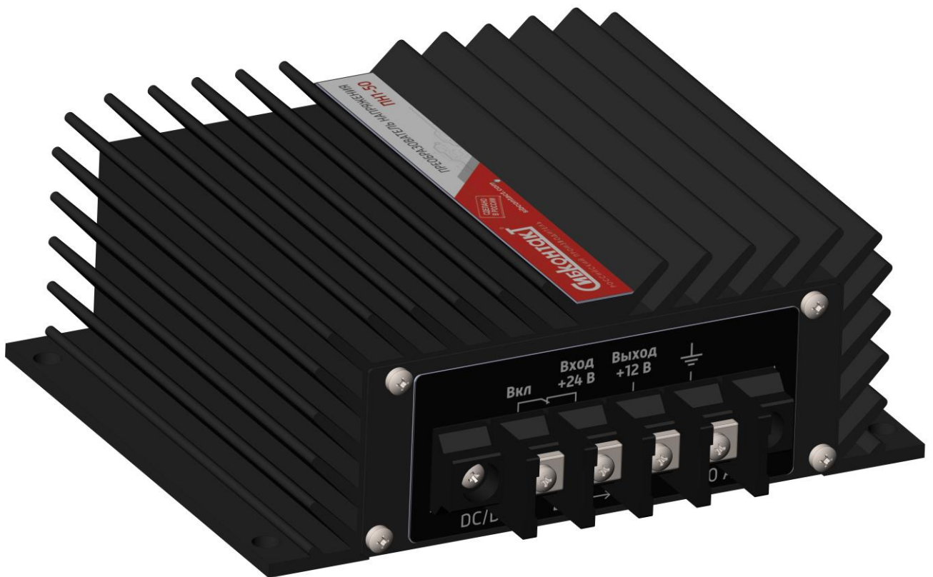
Рисунок 1. Общий вид ПН1-50

5.2 Корпус состоит из 3-х частей: Основание, крышка передняя, крышка задняя. На рисунках 1,2 указан общий вид ПН1-50