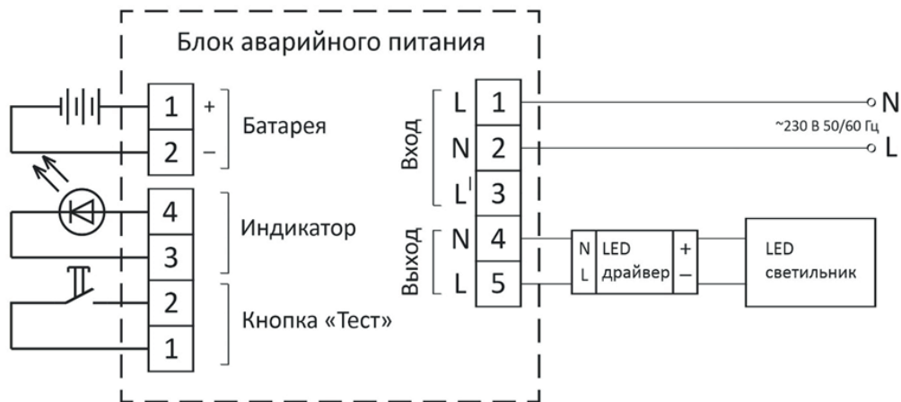
Рисунок 3 – Схема подключения БАП для работы в режиме непостоянного включения

5.2. Режим непостоянного включения: на рисунке 3 изображена схема подключения БАП для работы в режиме непостоянного включения. В данном режиме к контактам выхода БАП подключается LED драйвер и LED светильник. В цепях питания коммутационные изделия (помимо защитных) не используются, дополнительный контакт питания L1 остается неподключенным. При входном напряжении питания \sim 230 \text{ В} \pm 10\% 50/60 \text{ Гц} LED происходит подзарядка аккумулятора, но светильник не работает. При понижении входного напряжения до 132 – 187 В БАП переходит в аварийный режим работы, и LED светильник начинает работать от аккумулятора. Время работы светильника в аварийном режим – не менее 1 часа.