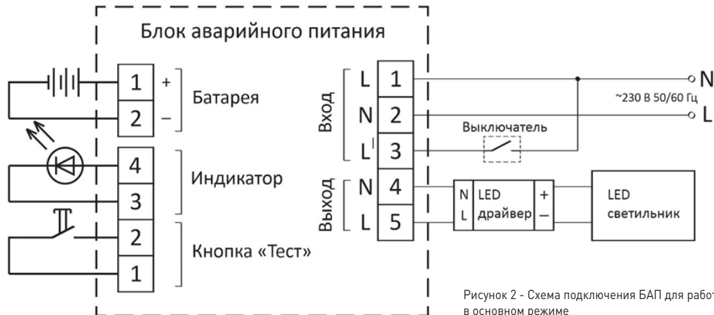
Рисунок 2 - Схема подключения БАП для работы в основном режиме

5.1. Основной режим работы: на рисунке 2 изображена схема подключения БАП для работы в основном режиме. В данном режиме к контактам выхода БАП подключается LED драйвер и LED светильник. Также в этом режиме используется дополнительный контакт питания L1, к которому через выключатель подводится L-проводник. При входном напряжении питания ~230 В ±10% 50/60 Гц LED светильник работает от сети питания, при этом также происходит подзарядка аккумулятора. При понижении входного напряжения до 132 – 187 В БАП переходит в аварийный режим работы, и LED светильник начинает работать от аккумулятора. Время работы светильника в аварийном режим – не менее 1 часа.