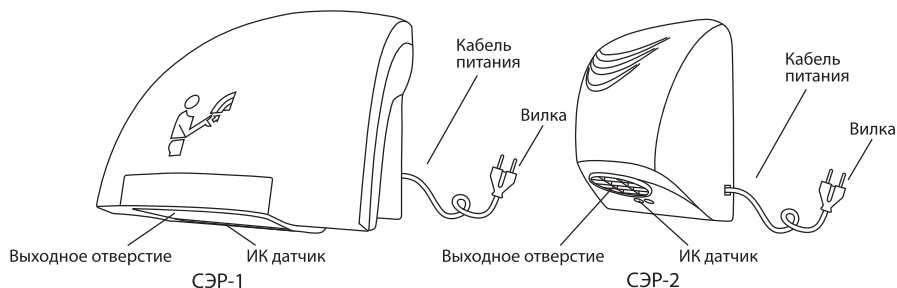
Рисунок 1. Устройство сушилок для рук