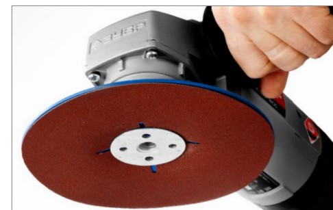
Максимально надежная фиксация фибрового круга

Применяется для жесткой фиксации фибрового круга на УШМ при выполнении предварительных, промежуточных и финишных шлифовальных работ.