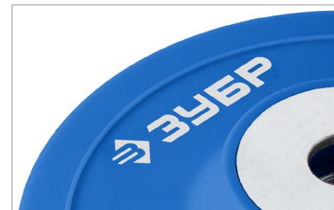
Ребро жесткости усиливает конструкцию