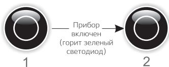
Схема 2. Включение фонаря (работает только в состоянии включенного металлоискателя)

Нажмите и удерживайте кнопку до появления звукового сигнала