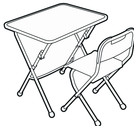
(рис. 3) арт. KPU1

Перед эксплуатацией следует ознакомиться с паспортом и руководством по эксплуатации. Следуя инструкции, выполните установку стола и стула.