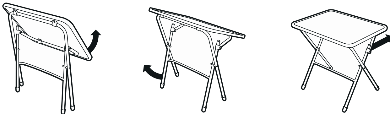
(рис. 4) Схема раскладывания стола

подпись ответственного лица, штамп торгующей организации