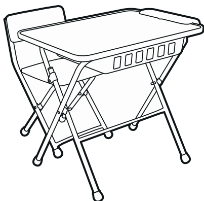
(рис. 1) арт. КУ2П