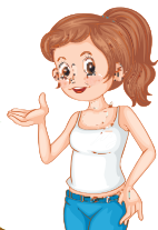
die Tante [ди: тэнтэ] тётя