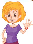
die Mutter [ди: мўтэ] мама