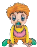
der Bruder [дэр брудэ] брат