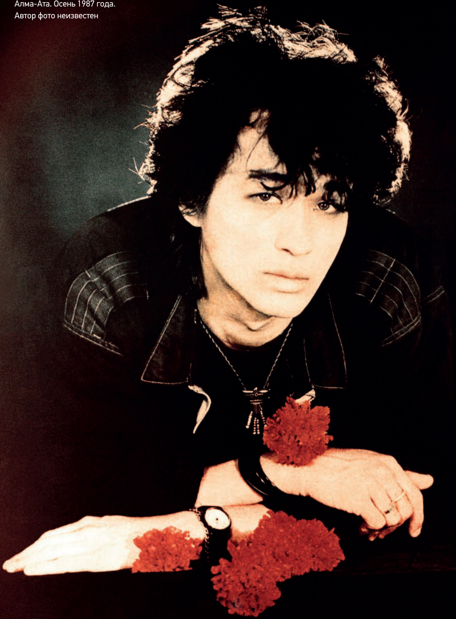
Алма-Ата. Осень 1987 года. Автор фото неизвестен