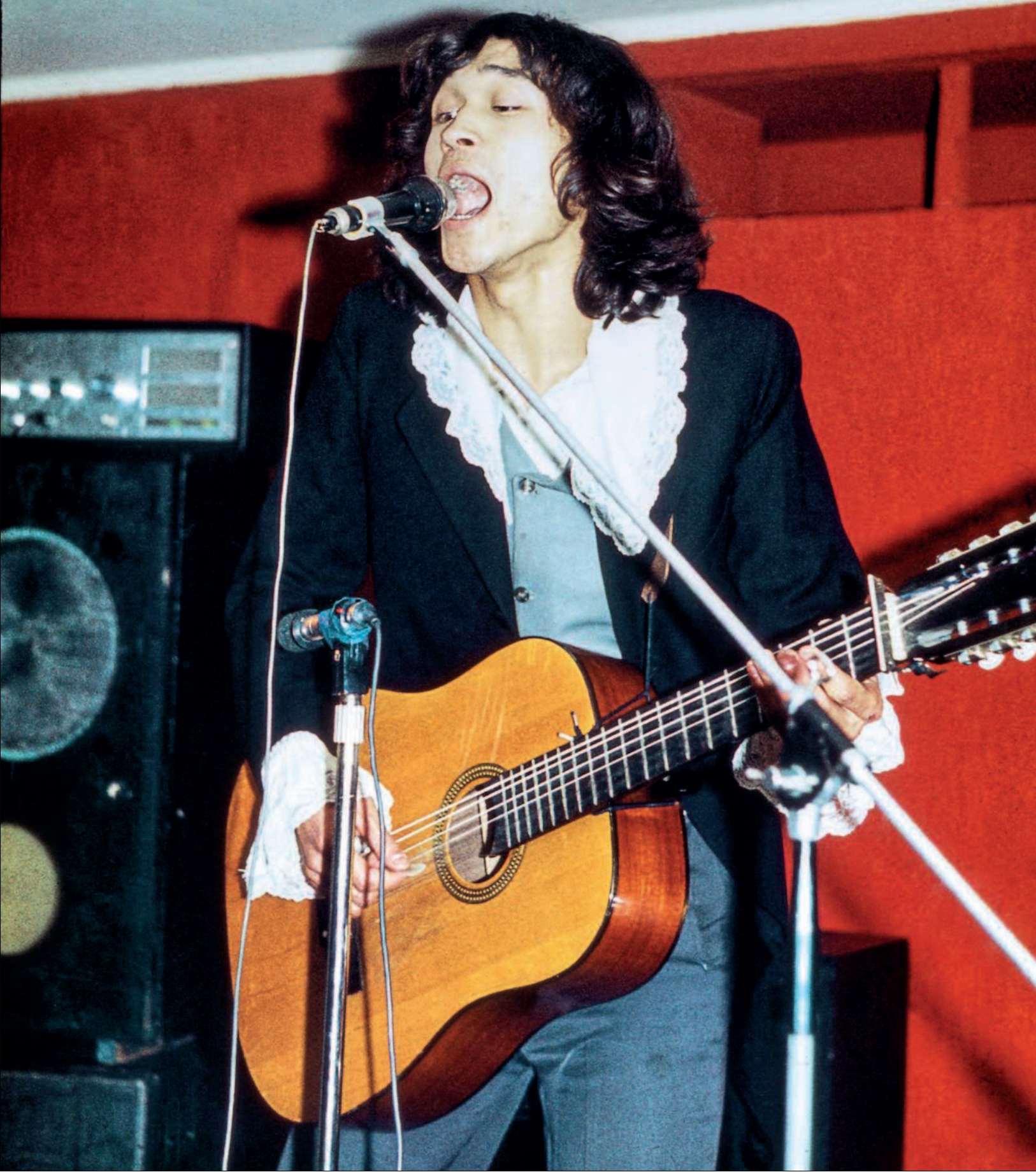
Цой в МИФИ. Москва, 20 октября 1982 года.