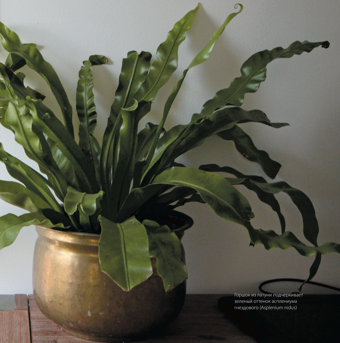
Горшок из латуни подчеркивает зеленый оттенок асплениума гнездового ( Asplenium nidus )