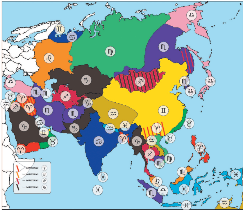
• Рис. 2. Астрогеография Азии: проекция знаков зодиака на страны Азии

государство в арабском мире с очень высоким уровнем жизни, право на долю от продажи нефти имеют все граждане. Гонконг и Тайвань — самые развитые и безопасные (безопасность относится к эссенциальной природе Тельца) страны Азии.