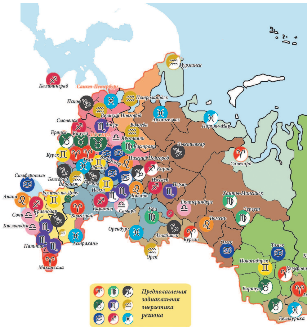
• Рис. 5. Астрогеография России: проекции знаков зодиака на города России